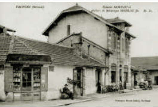
Exposition cartophile : vue ancienne de Facture