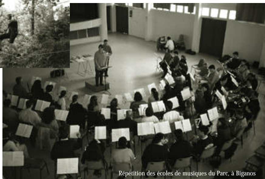
Répétition des écoles de musiques du Parc, à Biganos