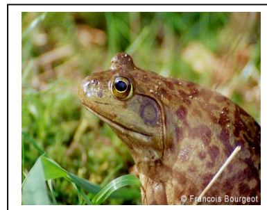
Têtard de grenouille taureau et un adulte

Dans les milieux où elle est présente, sa voracité représente un risque majeur pour la biodiversité (poissons, insectes, oiseaux). Cette espèce a été repérée depuis plusieurs années dans les plaines du Teich, mais la salinité du milieu devrait être un frein. Déclarée invasive, cette espèce fait l'objet d'un programme de suivi visant à son éradication.