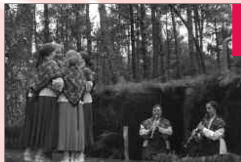
© S.C. - PN.R.L.G. Danses traditionnelles sous la pinède