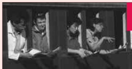
Artistes invitées pour Voix de traverse 2006

Ce projet est porté par l'association «Attention Chantier vocal» et est accompagné par le Parc. Il s'inscrit dans le cadre du programme de coopération leader + et bénéficie du partenariat de l'IDDAC de l'ADAM 40 et de la ligue de l'enseignement.