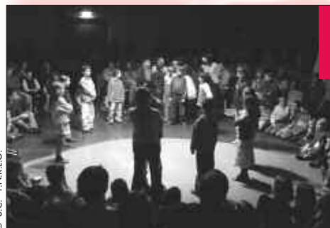
© S.C. - PN.R.L.G. Cercle de veillée locale

Mais le travail avec les partenaires précités ne s'arrête pas aux seules sollicita-