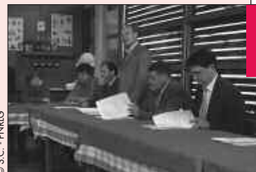
Signature de la charte Voix de traverse

Contacts : Iddac Landes de Gascogne, David Gaslain, 05 56 65 70 60 - gascogne@iddac.net Iddac 05 56 17 36 36