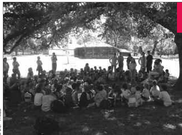
Classe culture à Marquèze. Voix de traverse : un projet

Agissant au quotidien avec les associations ou les organisateurs locaux, la mission d'animation culturelle essaie de catalyser les initiatives et de les épauler face à la complexité de l'organisation d'événements aussi petits soient-ils, et ce, tant sur le plan technique que promotionnel. Là, outre le fait qu'elle accompagne financièrement ou techniquement