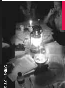
Pendant la nuit de l'écriture. A la bougie, "prête-moi ta plume"