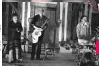
Scènes culturelles dans le Parc