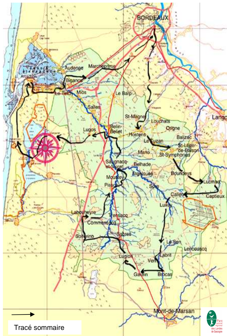
Fond de carte - PNR Landes de Gascogne

Cartes de référence utiles à votre Randonnée Permanente : N° 152 et n° 160, Top 100, Bordeaux-Mont de Marsan au 1/100 000 ème